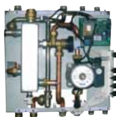
MT 3000 S ouvert