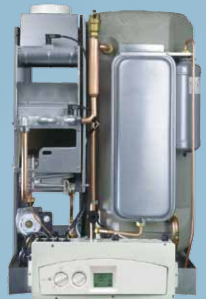
versions BS - AB