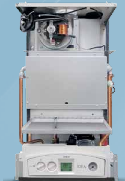
versions RS - AR - CS - AC